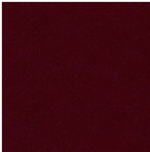
T375-68 - médicis