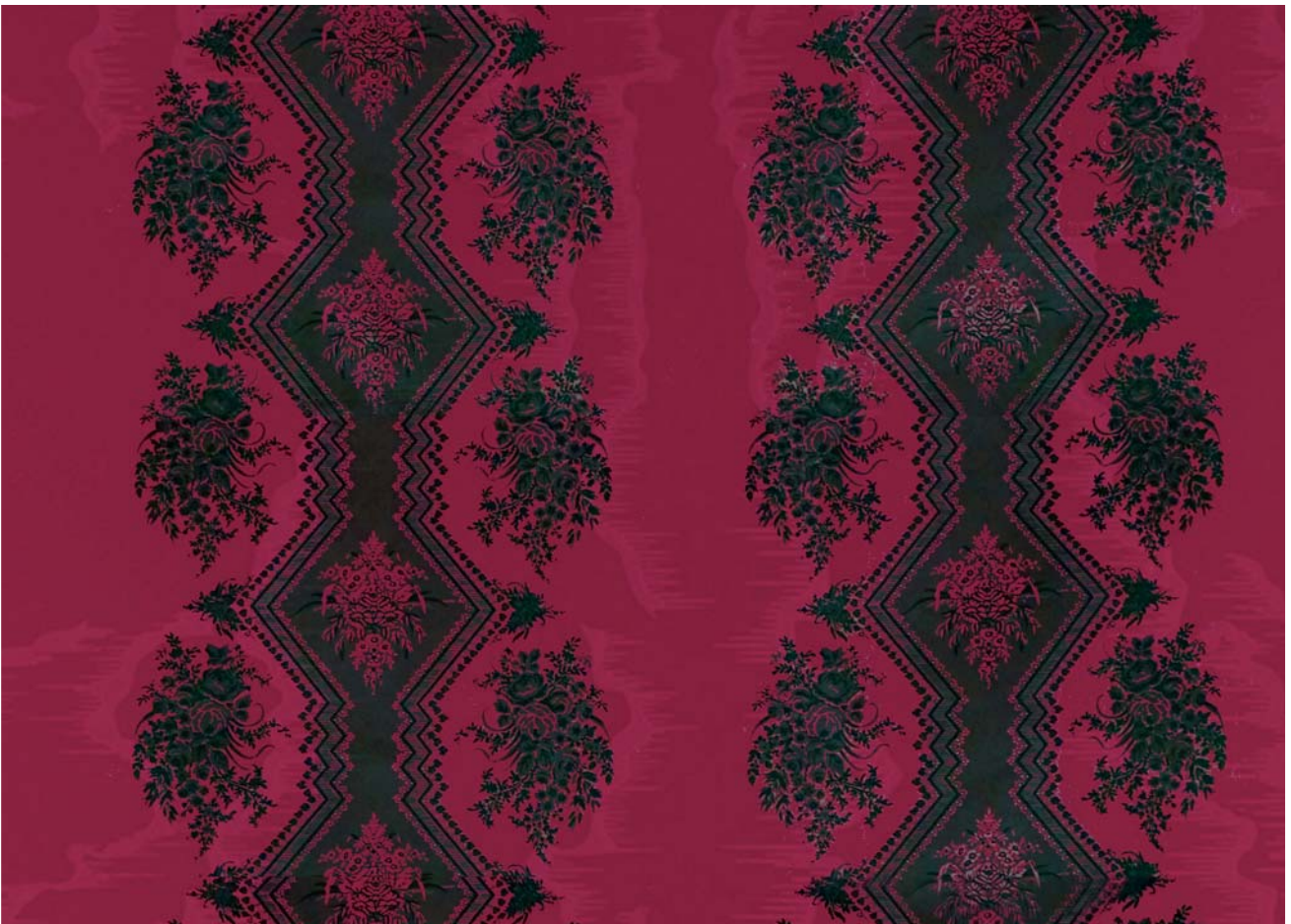
Coppelia moiré - rouge - réf : 15508-3