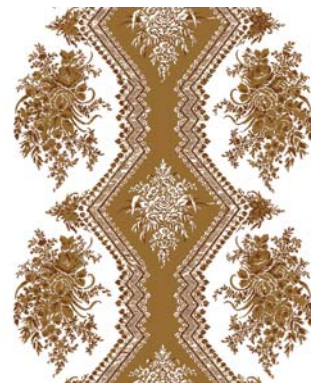
RM005-4 - tabac