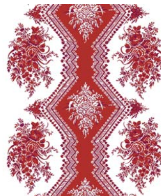
RM005-1 - rouge