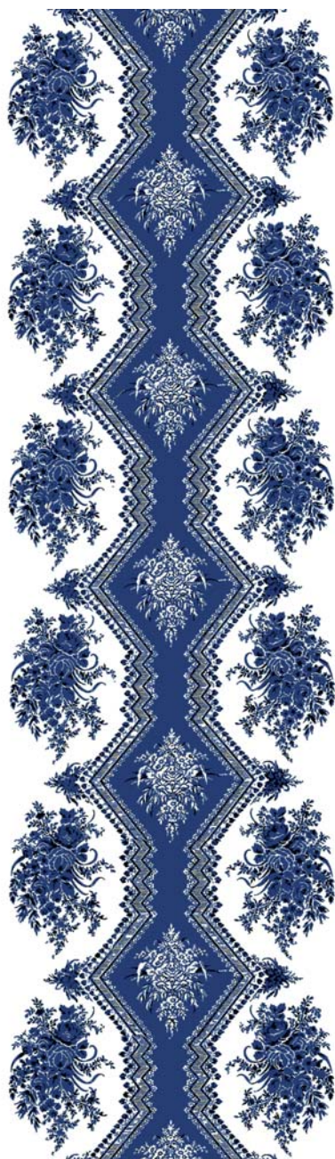
RM005-3 - pervenche