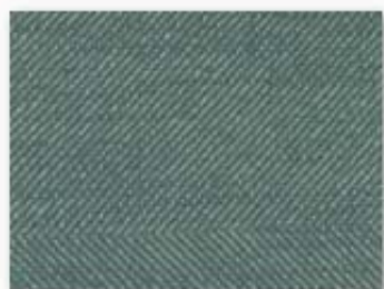
018 bleu charron