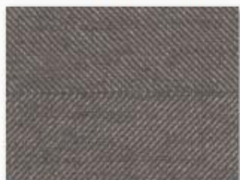
005 marron glacé