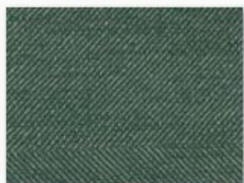
015 vert anglais