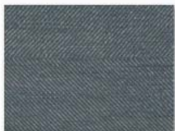
001 bleu de Nîmes