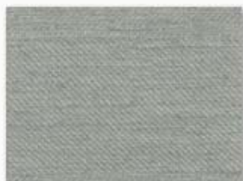
002 bleu ciel