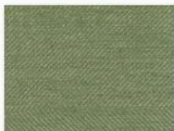
014 vert mousse