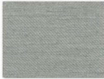
002 bleu ciel