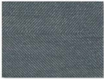
001 bleu de Nîmes