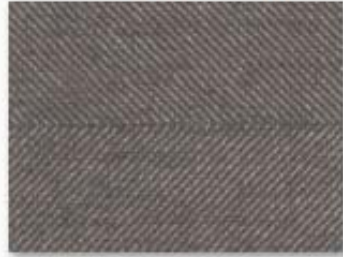
005 marron glacé