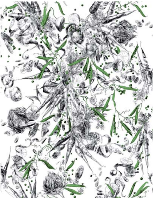
RM102-02 - petits pois