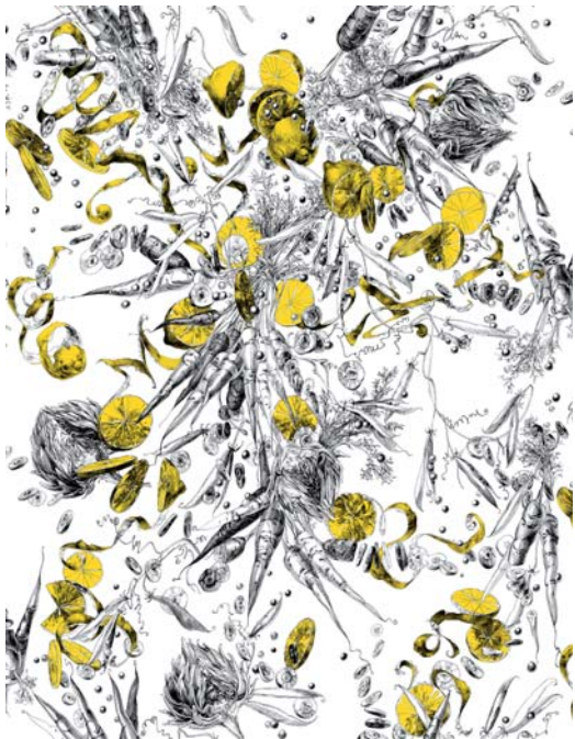
RM102-01 - citron