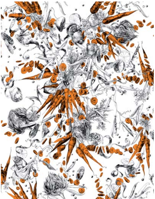
RM102-03 - carotte