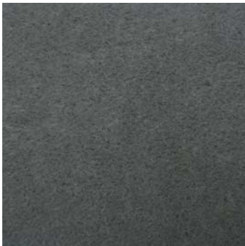
15610-07-Vert de gris