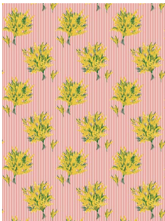
02 rouge corail