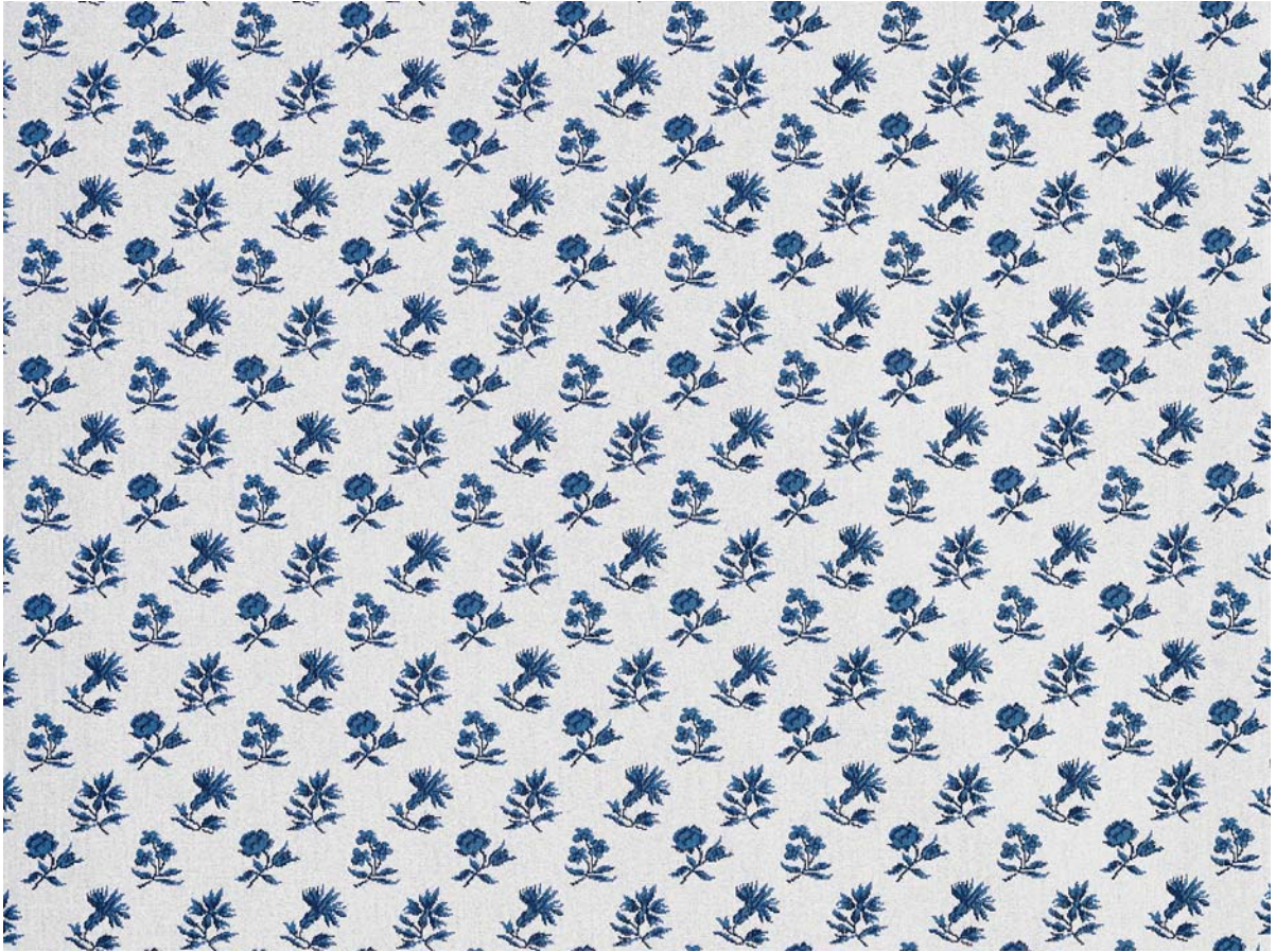
Mozart - bleu - réf : 18267