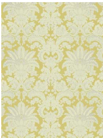
009 or 2