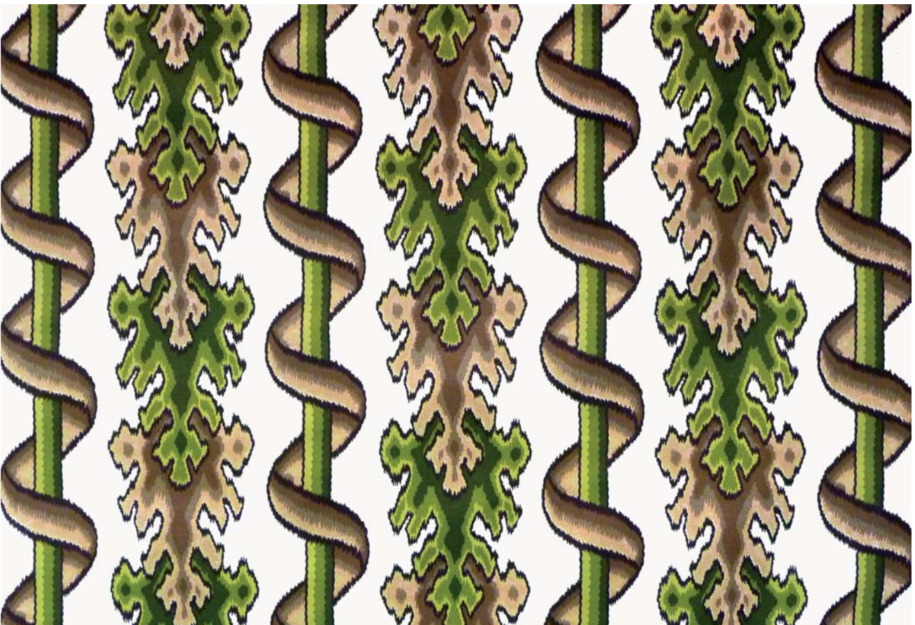
11567 - vert