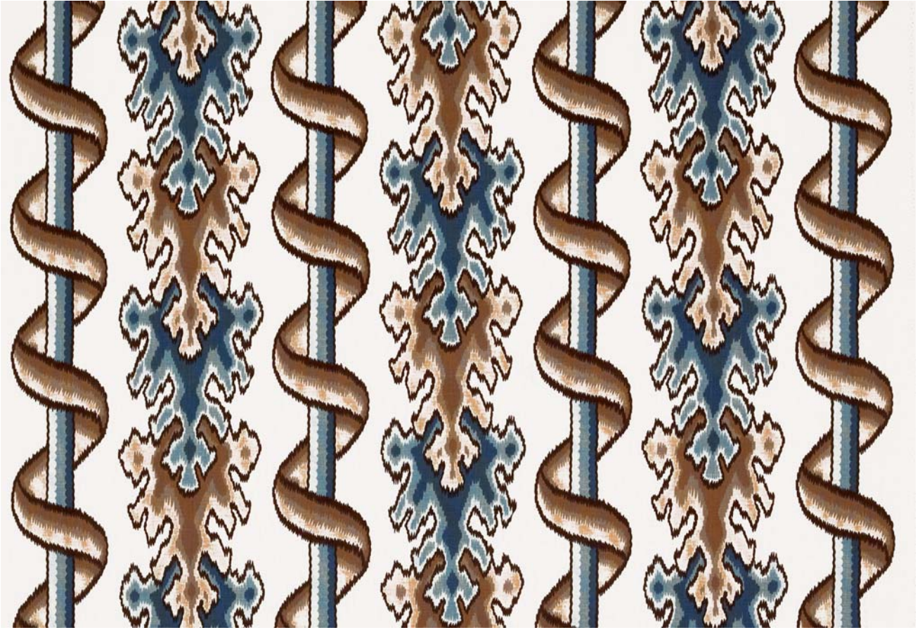
11566 - bleu