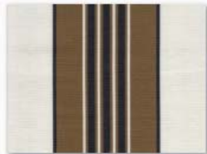
15620-006 tabac espagne