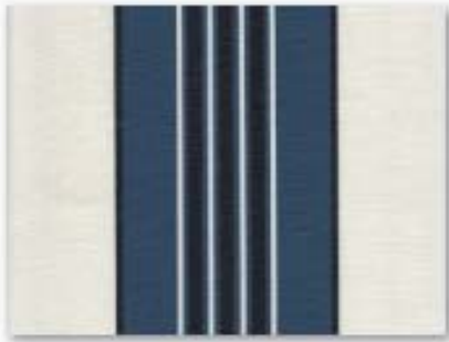
15620-001 rive gauche