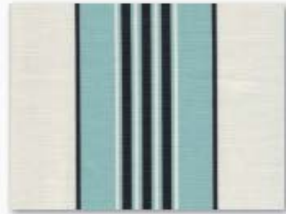
15620-002 bleu ciel