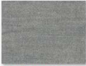
001 bleu de Nîmes