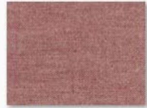
009 rouge basque