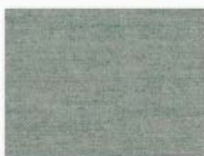
020 bleu charron