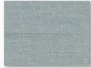
003 bleu ciel