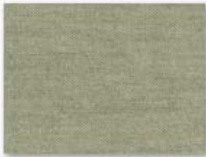
016 vert mousse