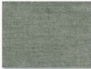
017 vert anglais