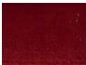
010 rouge carmen