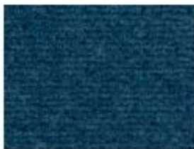
027 bleu de sèvres