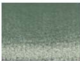
023 vert d'eau